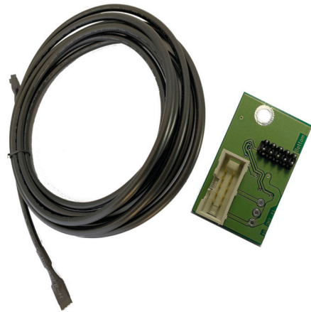
MOVEO Communication kit