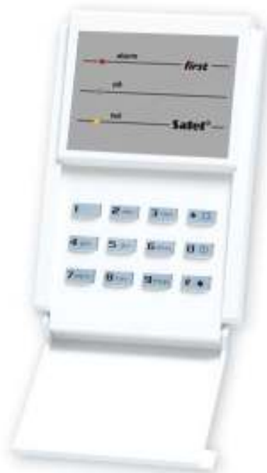
Figur 3. FIRST S område tastatur

feil (gul) – blinker ved teknisk feil i sentralen . Gå til LCD tastaturet for informasjon om hva slags feil. Denne indikerer feil for hele systemet, ikke bare for området. Tilkobling av området kobler ut dioden, og frakobling kobler dioden inn. Den vil blinke til feilen er vist i LCD tastaturet og feilminnet er tilbakestilt (opsjon FEILMINNE INNTIL VISNING er tillatt) eller til feilkilden opphører (opsjon FEILMINNE INNTIL VISNING er ikke tillatt) PROG .